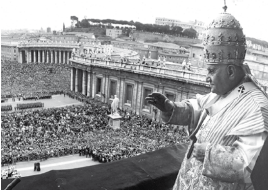
Juan XXIII, Pascua, Plaza san Pedro, 22 abril 1962

En preparación a la Vigilia de Pascua meditamos juntos con Juan XXIII: