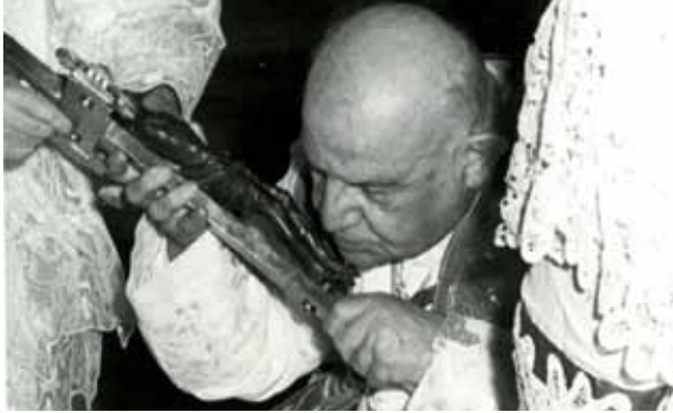
Juan XXIII, Viernes Santo, S. Pablo extramuros, 20 de abril 1962

Como introducción al Triduo Pascual leemos las palabras del Papa Juan XXIII: