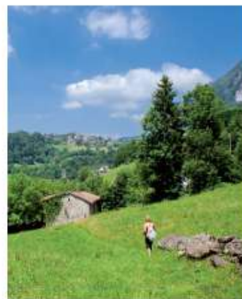
Frazione Gardati lungo il tracciato alto della Via Mercatorum, ormai in vista di Cornalba. Da qui il percorso proseguiva verso Serina e Dossena.

condannati ai lavori forzati. Nei pressi di Olmo al Brembo invece la Via Mercatorum intreccia un tratto del suo percorso con la Via del ferro. Già nel medioevo la Val Brembana diviene punto di riferimento per i suoi "mastri ferrai" al di fuori dei confini bergamaschi. La Via Mercatorum, nata per esigenze primarie di approvvigionamento, si è fatta via di comunicazione, possibilità di scambio, relazione e interazione tra realtà fisicamente molto lontane per i mezzi di trasporto del tempo, su un territorio duro, quello montano della valle Brembana che conduce attraverso gli storici valichi di Morbegno e Albarino verso genti e luoghi nuovi.