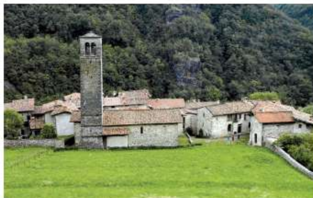
Il borgo medievale di Cornelio dei Tasso, con la chiesa dei Santi Cornelio e Cipriano. Il suo nome si lega alla stirpe dei Tasso, famosa per il poeta Torquato e per il contributo che diede alla creazione del servizio postale.

Giovanni Bellini e dalla nuova pittura tonale di Giorgione e Tiziano che ho svolto il mio allunato, ed è qui che è sbocciata e si è sviluppata la mia carriera artistica, lavorando principalmente per altolocati committenti della laguna. Una mostra antologica intitolata "Lo sguardo della bellezza" dedicata alle mie opere è stata promossa dal Comune di Bergamo in occasione di Expo 2015, con dipinti provenienti da istituzioni museali italiane ed estere tra cui il Musée du Louvre di Parigi, la National Gallery di Londra, il Museo Thyssen-Bornemisza di Madrid, il Kunsthistorisches Museum di Vienna e la Gemäldegalerie di Dresda.